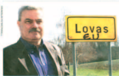
NAČELNIK MILAS RADE DA SU SVEŠTOČNA JAVNA UTR

“ ZBOG DOLASKA MLADIH OBITELJI, DEMOGRAFSKA SLIKA NAM SE POPRAVLJA... i o "baby boomu" ”