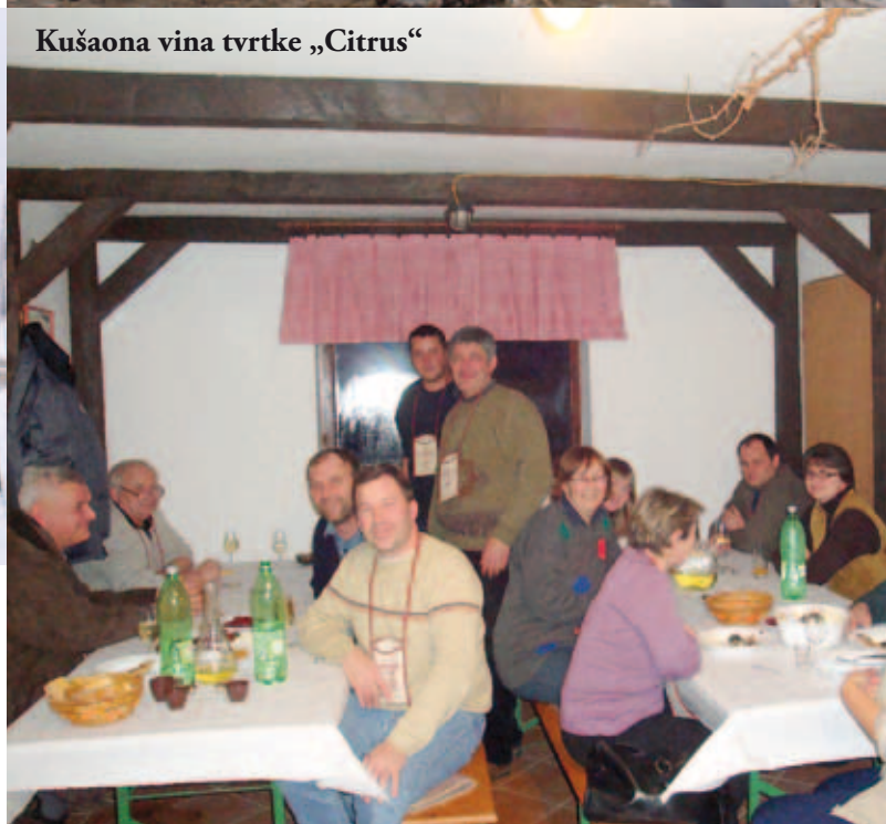
Kušaona vina tvrtke „Citrus“