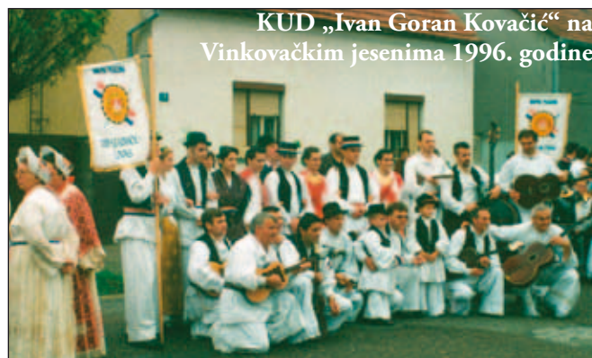
KUD „Ivan Goran Kovačić“ na Vinkovačkim jesenima 1996. godine