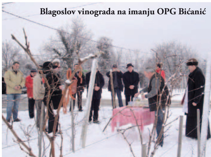
Blagoslov vinograda na imanju OPG Bičanić