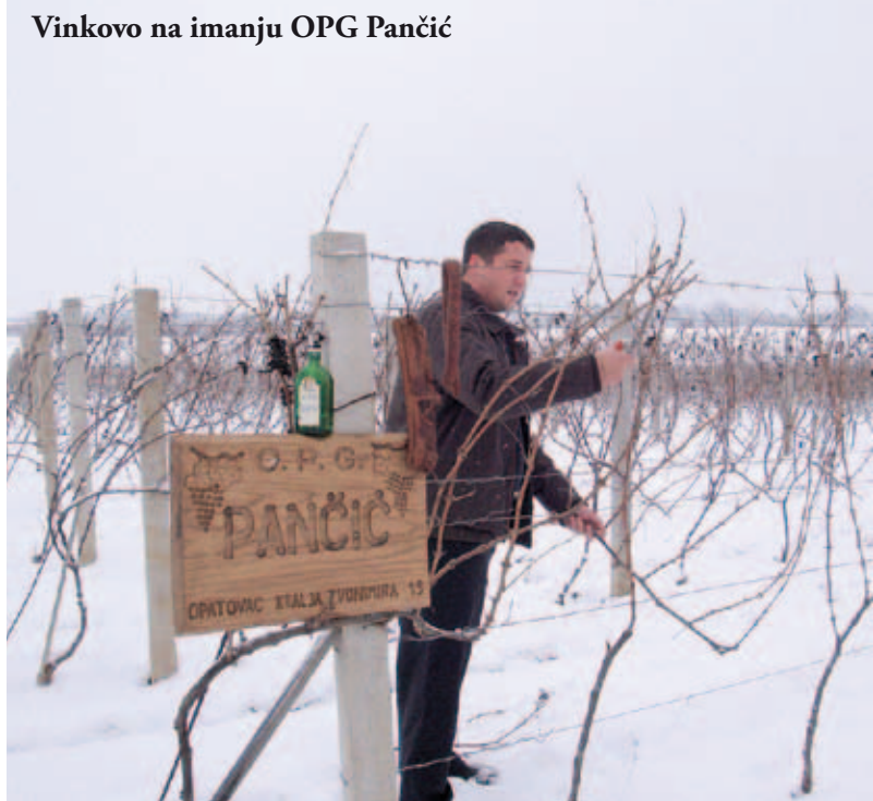
Vinkovo na imanju OPG Pančić