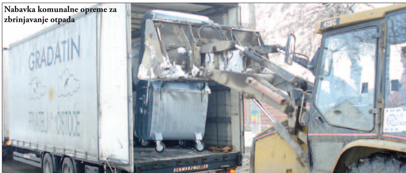
Nabavka komunalne opreme za zbrinjavanje otpada