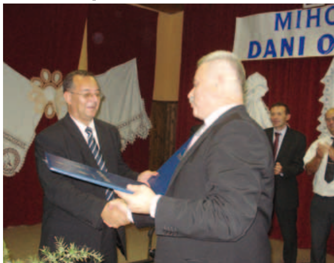
Lovas, 25. rujna 2009. godine – potpisana povelja prijateljstva s općinom Malinska-Dubašnica .....