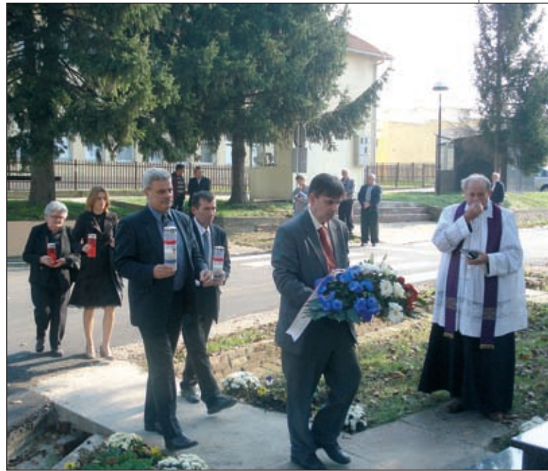
Lovas, 18. listopada 2008. – Spomen obilježje