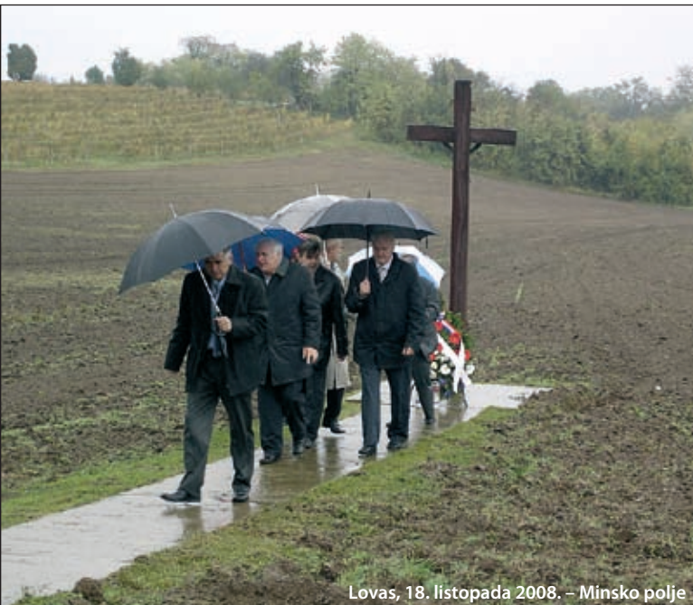
Lovas, 18. listopada 2008. – Minsko polje