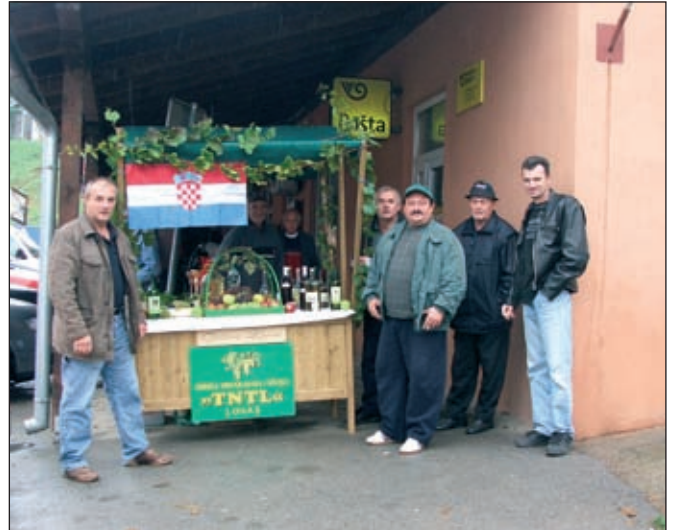
Izložbeni štand Udruge vinogradara i vinara TNTL