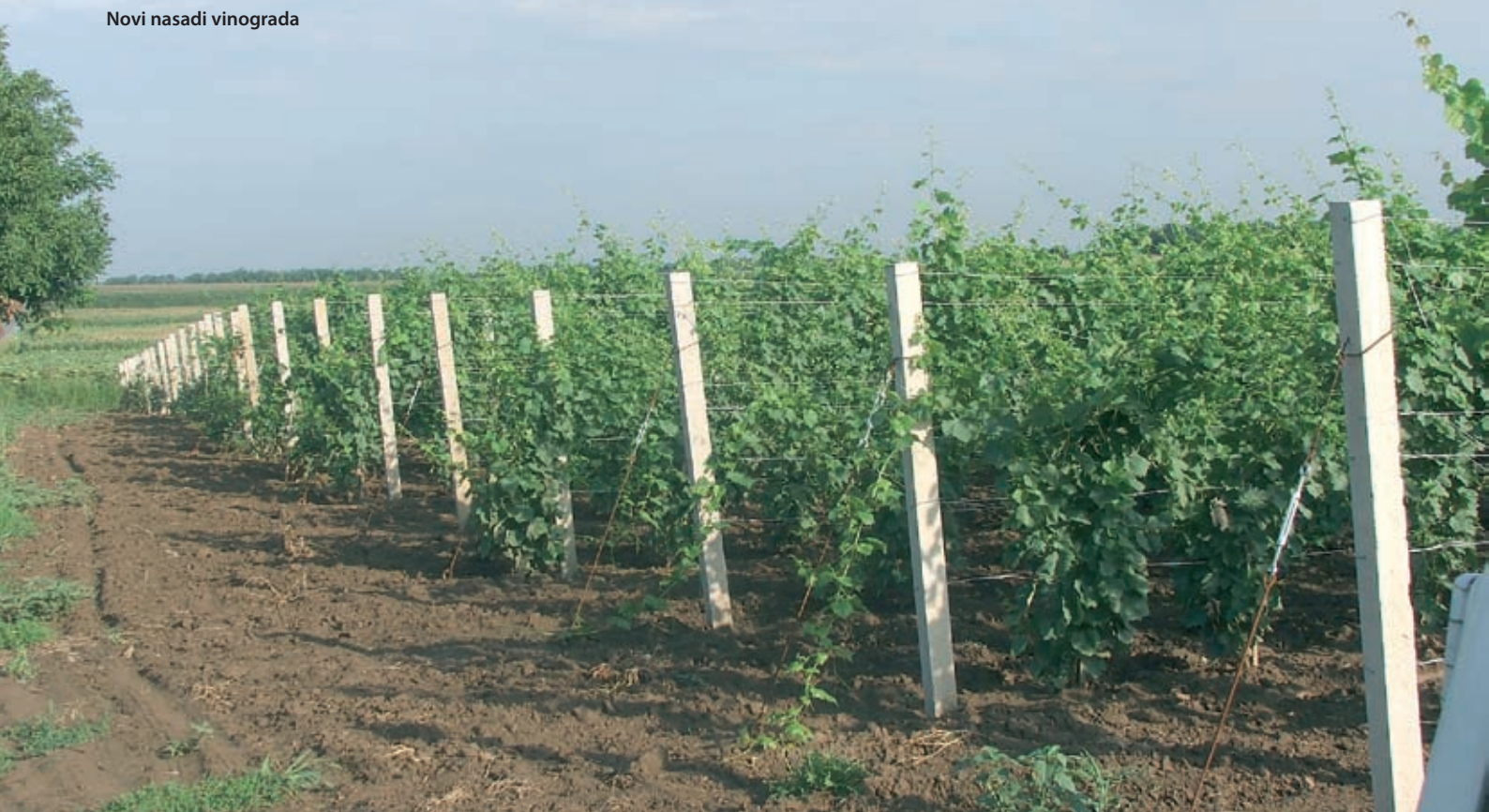
Novi nasadi vinograda