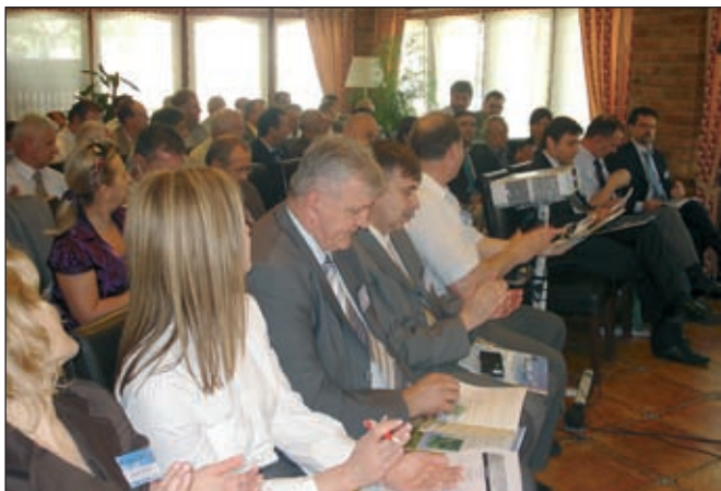
Završna konferencija projekta AGRO-DEV