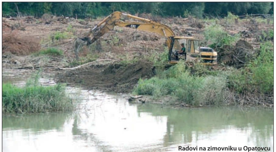
Radovi na zimovniku u Opatovcu

Nadalje, u tijeku je realizacija II. faze Pilot projekta navodnjavanja - izgradnja vodozahvata i dovođenje vode na njive. Za dan općine očekujemo potpisivanje ugovora s tvrtkom koja će projekt realizirati. Radovi na zimovniku Opatovac u vrijednosti od 10 milijuna kuna su u tijeku. Brana na Akumulaciji Opatovac u vrijednosti od 18 milijuna kuna je završena. Svemu ovome treba dodati da tvrtka Arator d.o.o. završava radove na svojoj farmi muznih krava. Sve je više novih višegodišnjih nasada voćnjaka i vinograda što u poduzećima što u obiteljskim poljoprivrednim gospodarstvima. Sve to pokazuje perspektivnost naše općine čemu značajan doprinos daju i tvrtke koje djeluju na ovom području (VUPIK, Arator d.o.o.,