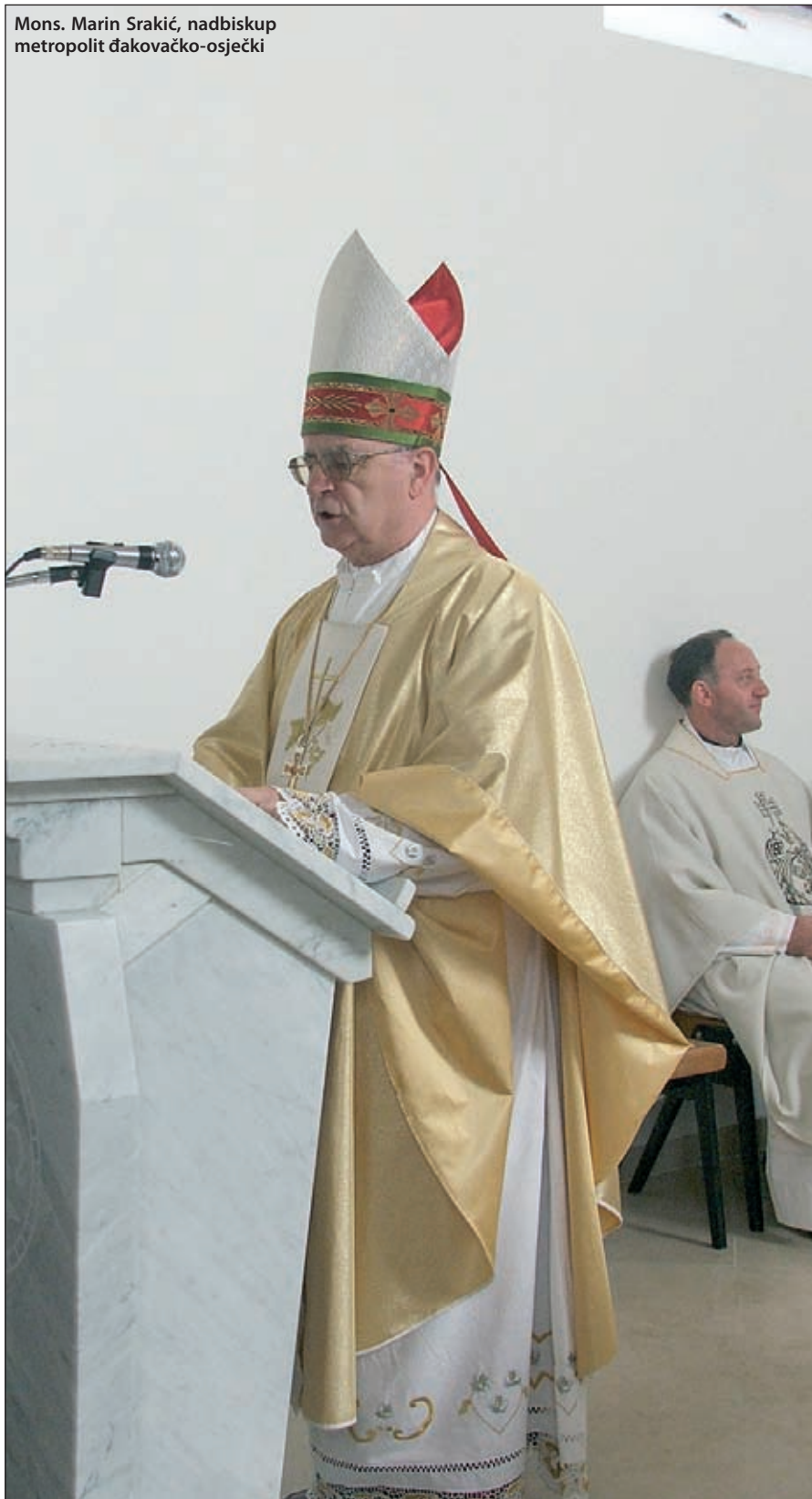
Mons. Marin Srakić, nadbiskup metropolit đakovačko-osječki

(Priopćenje je u podne, u srijedu 18. lipnja 2008. u Đakovu objavio apostolski nuncij u Republici Hrvatskoj, mons. Mario Roberto Cassari.)