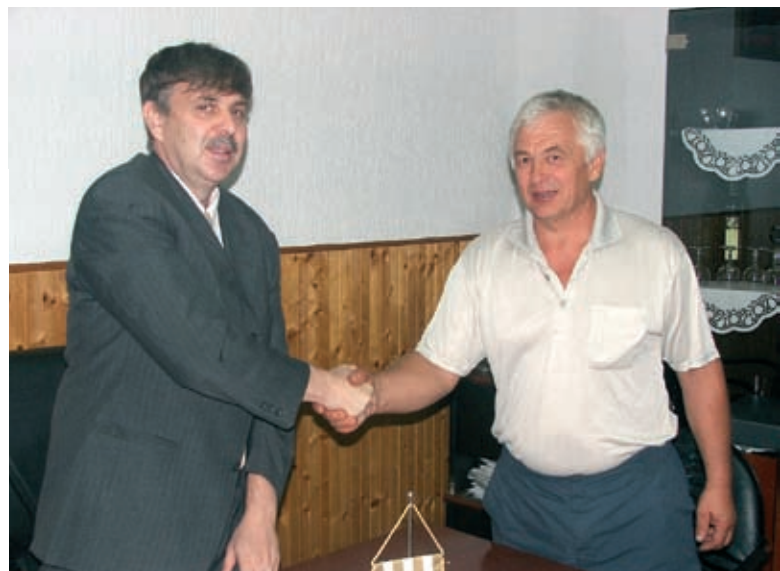
Svečano potpisivanje ugovora