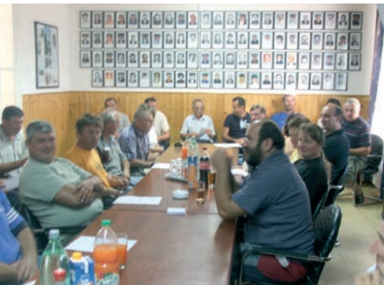
Sastanak s poljoprivrednicima