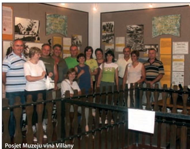
Posjet Muzeju vina Villany