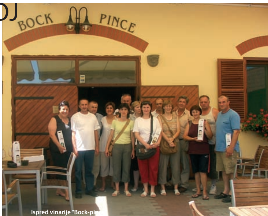
Ispred vinarije "Bock-pince"