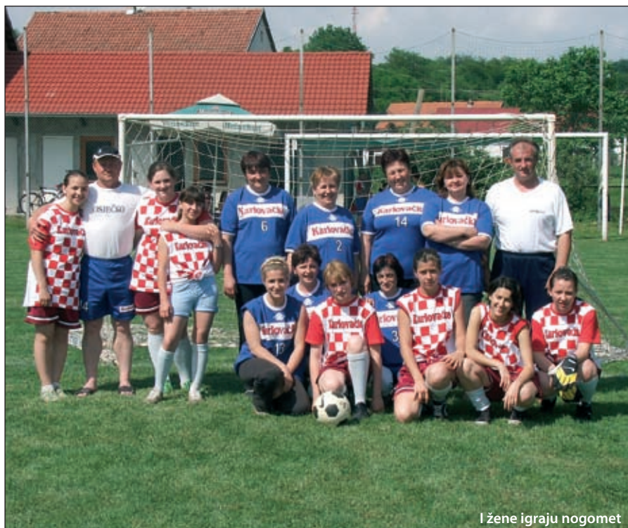
I žene igraju nogomet