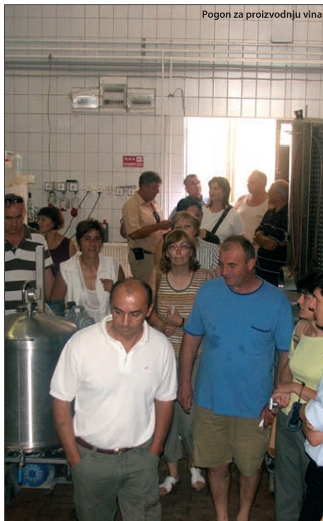
Pogon za proizvodnju vina