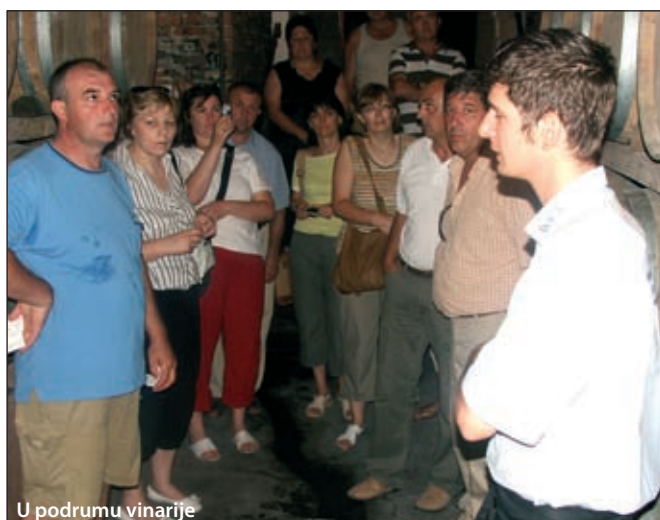
U podrumu vinarije